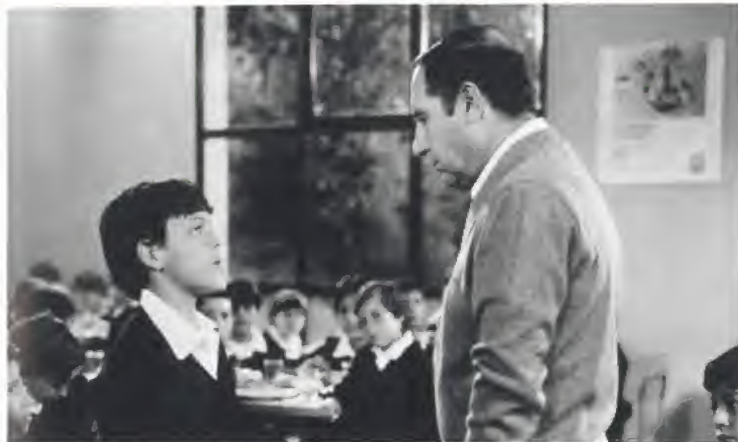
Pedrito Fernández - Alfredo Landa